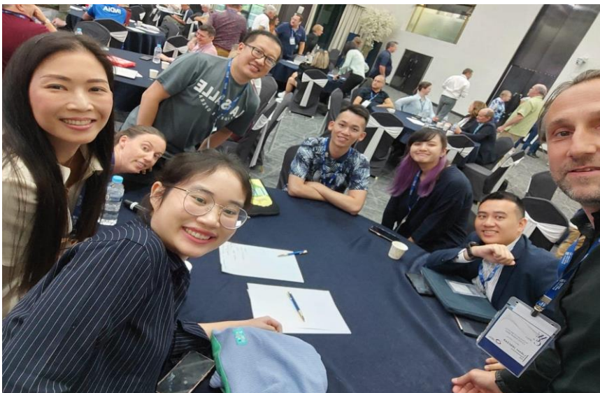
在公開議題與各國代表分組討論